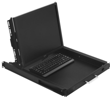
Рисунок 1 – В рабочем положении

На рисунках 1 и 2 представлен общий вид выдвижной полки для монитора.