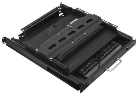
Рисунок 2 – В собранном виде