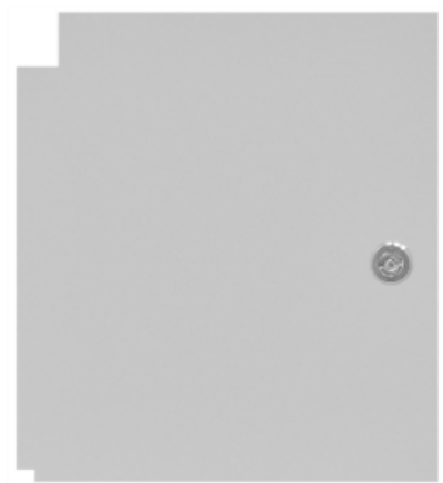
Рисунок 1 - Общий вид